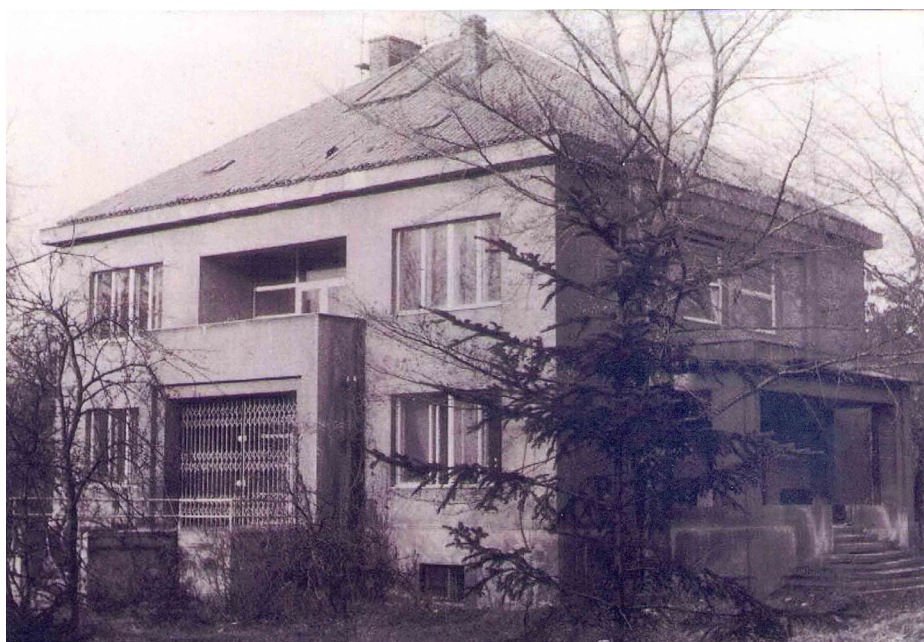
Historická fotografie nymburské Tortugy.